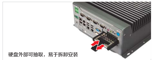
硬盘外部可抽取,易于拆卸安装